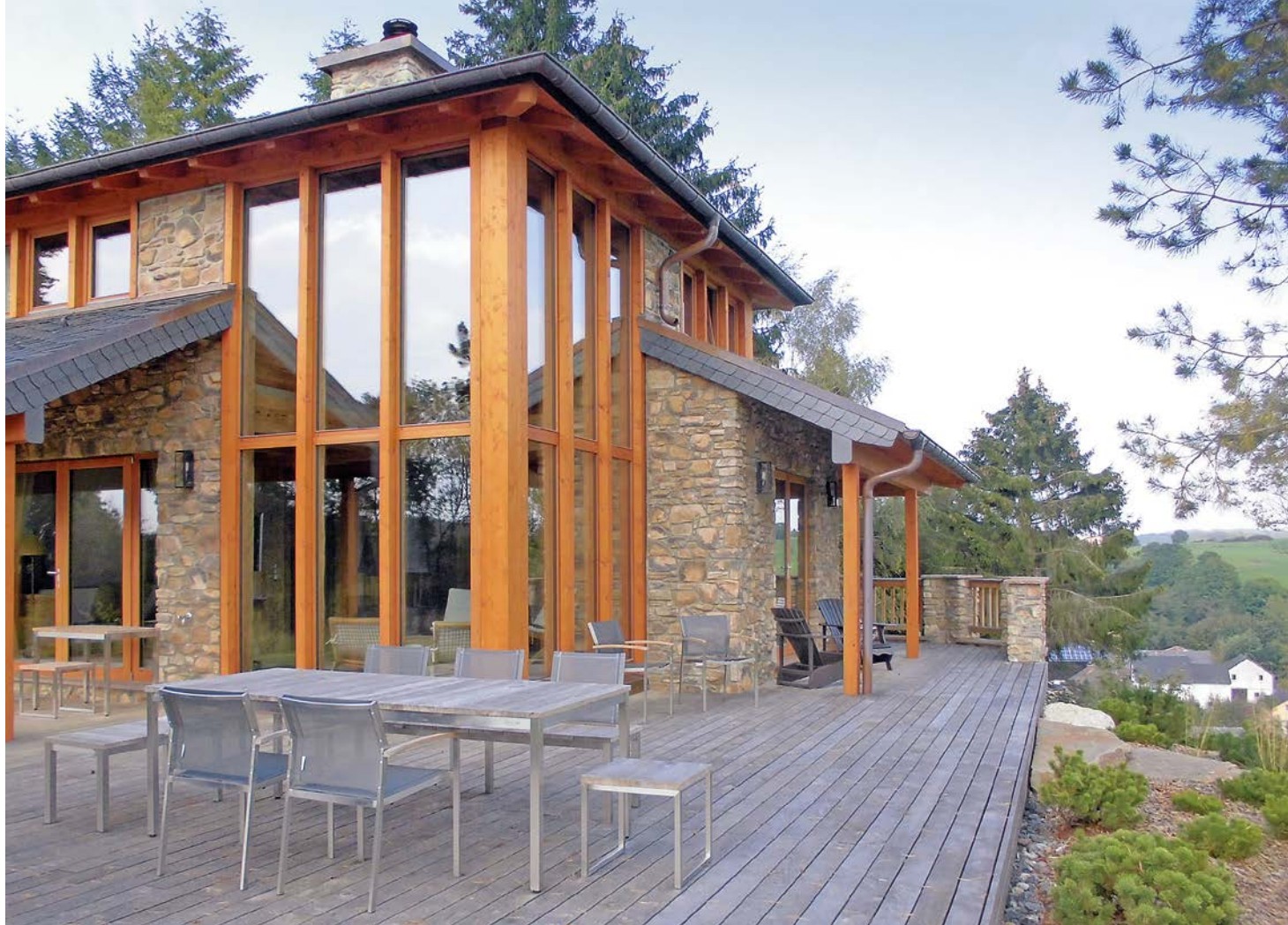
Floss bietet ein großes Spektrum an Holzbauleistungen wie hier eine Kombination von Massiv- und Holzbauweise.