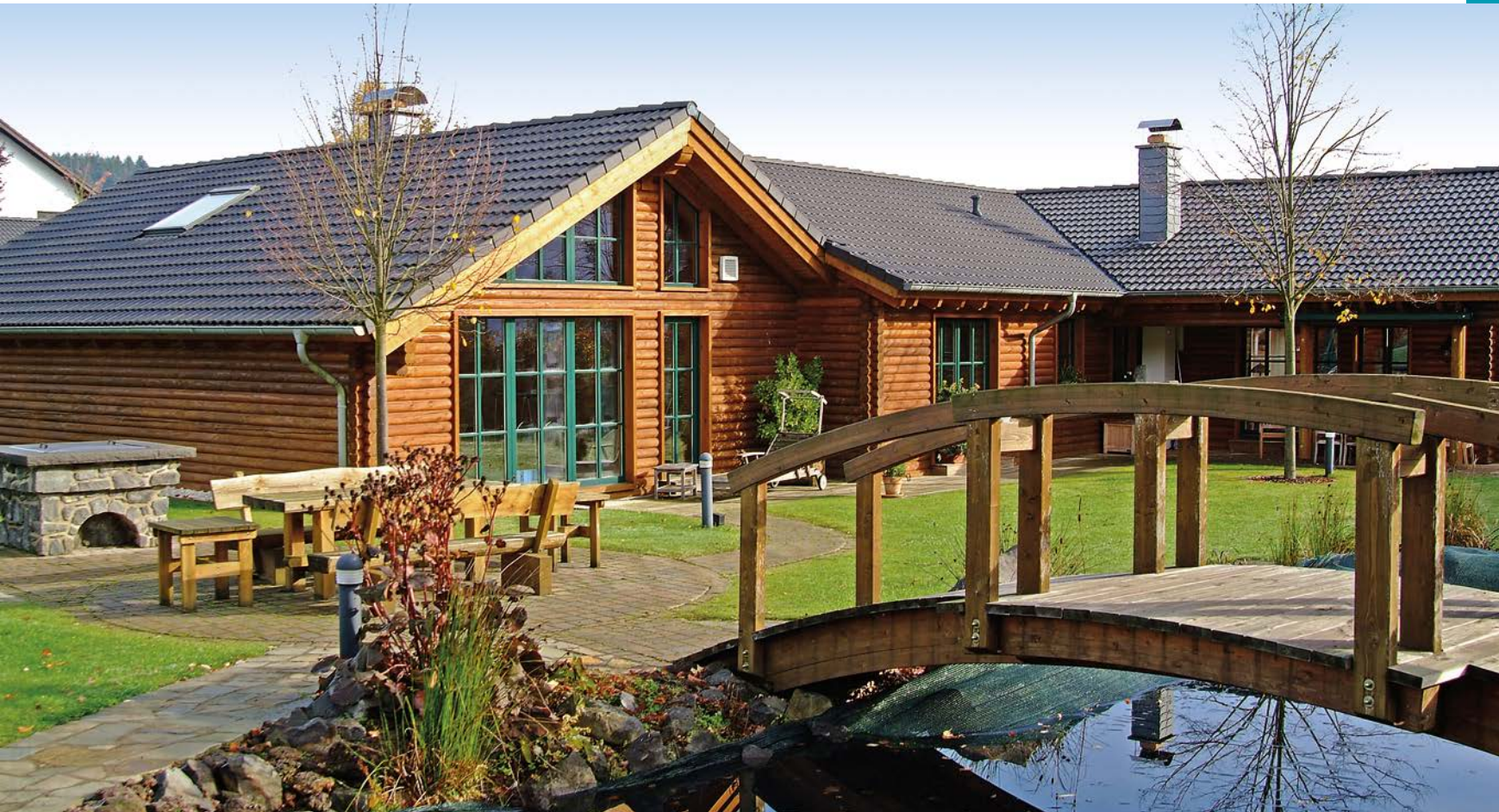
Die Blockhaus-Profis: Floss hat bereits über 250 Häuser in dieser Bauweise errichtet.

Blockhäuser zählen in Europa zu den ursprünglichsten Bauweisen für Wohnhäuser. Vor ca. 3.000 Jahren wurden in den waldreichen Regionen Mitteleuropas die ersten Häuser aus Rundstämmen gebaut. Auch wenn das moderne Blockhaus in Sachen Komfort und Energieeffizienz mit den Bauten von einst nicht mehr viel zu tun hat, so gelten viele Pluspunkte damals wie heute: Umweltfreundlichkeit, Langlebigkeit, hoher Schutz und die natürliche Ästhetik.