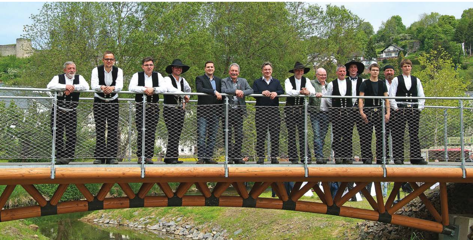
"Belastungstest" durch die Mitarbeiter der Firma Floss: Die Holzbrücke verfügt über ein Knotenpunktsystem aus einem speziellen Polymerbeton.

Derartige innovative Projekte sind nach dem Geschmack der Eifeler Holzbauer. Ähnlich auch beim Hausbau: standardisierte Lösungen sind nicht unbedingt ihr Fall. Sie verwirklichen lieber gemeinsam mit den Bauherren individuelle Lösungen. Dennoch bleibt es auch Ziel der beiden Söhne, alte Traditionen zu bewahren.