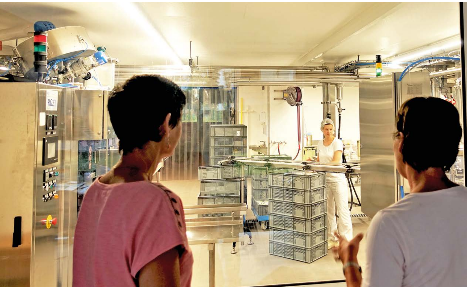
Bei einem Besuch in der Molkerei lässt sich auch ein Blick in die laufende Produktion von Milch und Joghurt werfen.